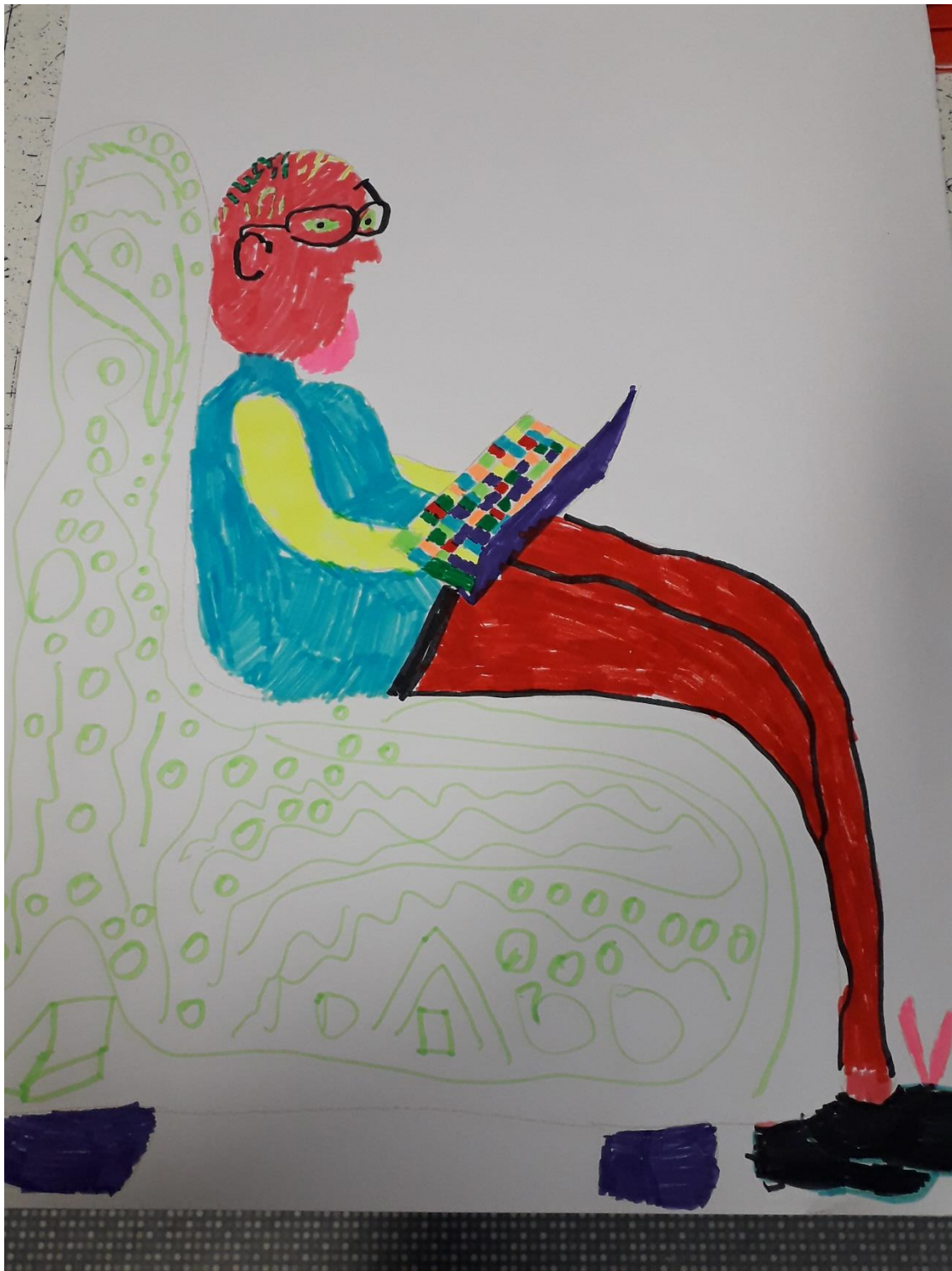
PRACA UCZNIĄ 5 KLASY POLSKO-NIEMIECKIEJ SZKOŁY PODSTAWOWEJ